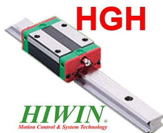
Guías lineales hiwin hgh