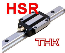
Guías lineales THK hsr